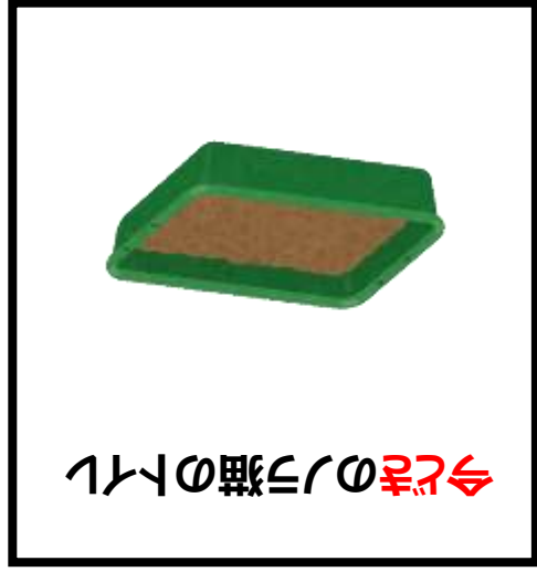
今どきのノラ猫のトイレ

今どきは、ご飯を与える人が、 ノラ猫用に清潔なトイレを用意し うちやおしっこを減らしました