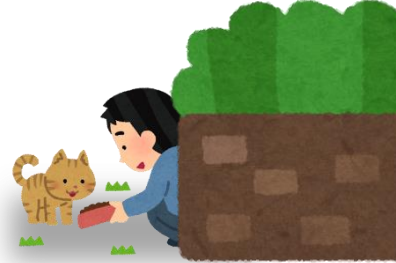
むかしのノラ猫の食事

むかしは、 ノラ猫がお腹をすかせてかわいそうだと 無責任にご飯を与える人がいて トラブルの元になっていました