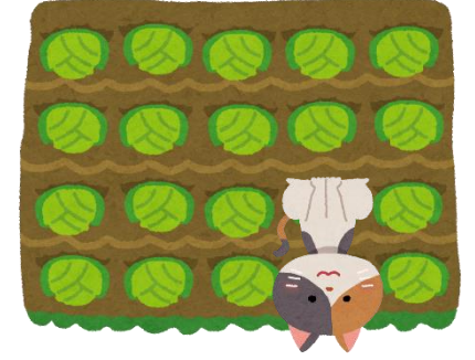
むかしのノラ猫のトイレ

むかしは、ノラ猫が 畑や花だん、公園の砂場などで らんちやおしっこをして困っていました