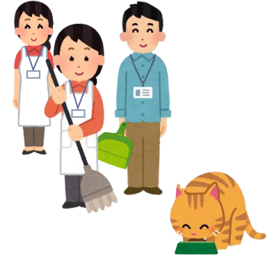
今どきのノラ猫の食事

今どきは、グループで 決まった時間に 食べ終わるまで待つて 食べ終わったら周辺の掃除をします